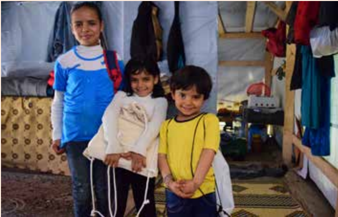
Niños en el Líbano que han recibido edredones y kits de LWR a través de Anera

EL 29 DE JULIO DE 2020 , tres contenedores de envío de edredones y kits de Lutheran World Relief llegaron al puerto de Beirut. Los artículos estaban destinados a servir a más de 24.000 refugiados de toda la región que se refugian en el Líbano. Los contenedores estaban en el puerto, esperando el despacho de aduana antes de que LWR se los entregara a nuestro socio, Anera.