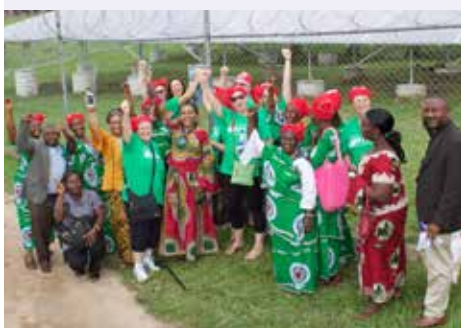
Foto de Jason Edens de participantes en la ceremonia de inauguración parados delante de los nuevos paneles solares

Mary Jo agradeció a las mujeres liberianas por darle el coraje para actuar en su fe e ir detrás del proyecto solar. Valora preguntó, “¿Qué les hace seguir adelante como mujeres de la iglesia de Liberia?” La mayoría estuvo de acuerdo en que reunirse para la oración y estudios bíblicos les da fortaleza y el apoyo para servir a otros y a Dios. Dijeron que están comprometidas en alentar a la