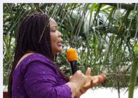
Leymah Gbowee habla en la ceremonia de inauguración de Phebe Hospital