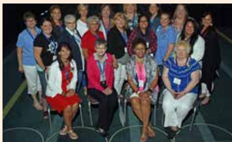
New board members